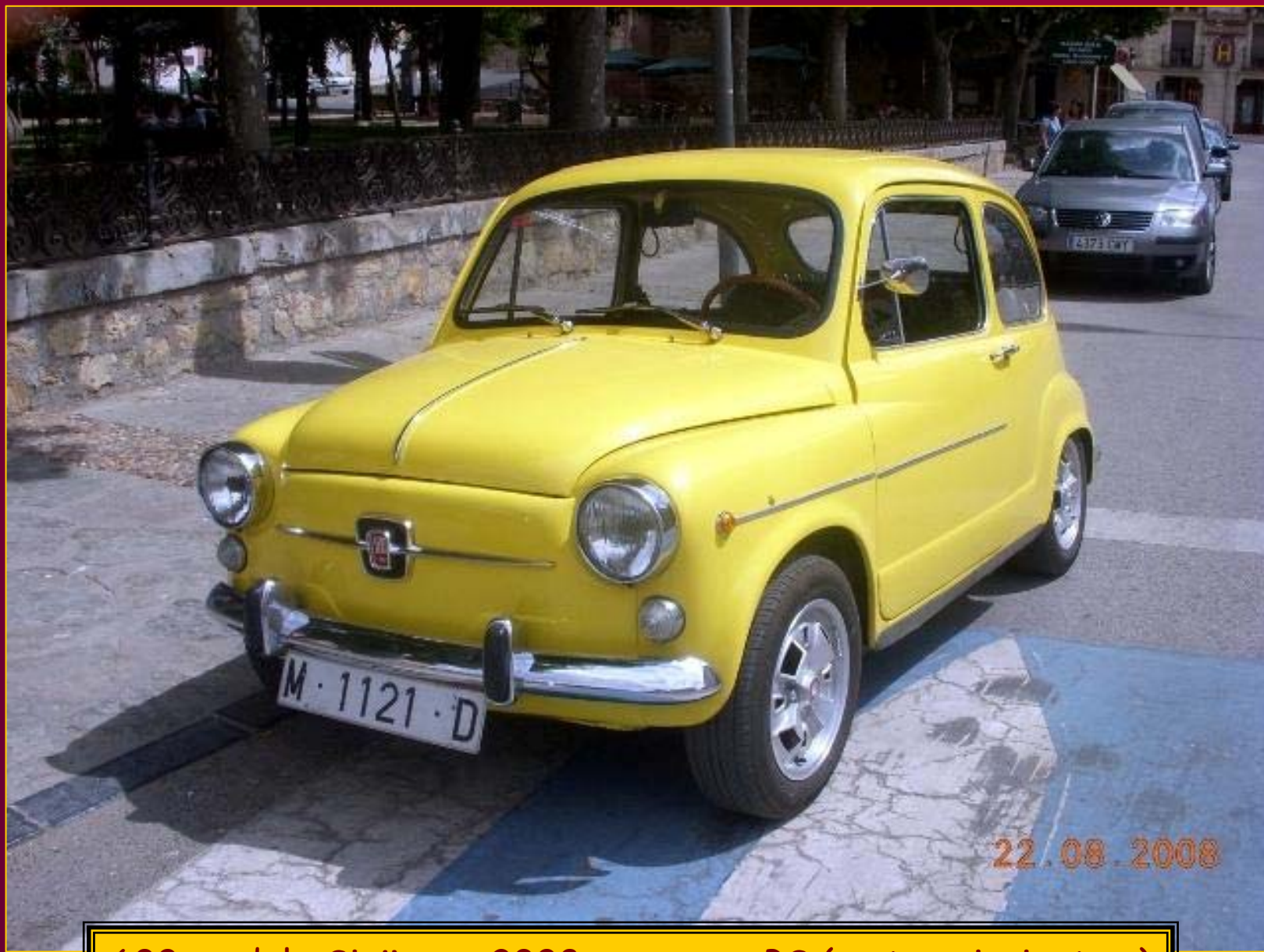
600 modelo Sigüenza 2008 que no es PS ( puto seiscientos )